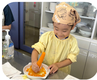
にんじん”すりすり”